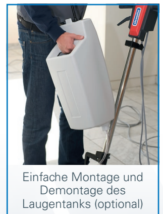
Einfache Montage und Demontage des Laugentanks (optional)