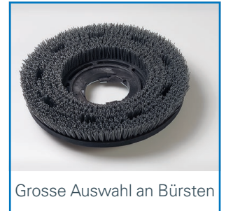
Grosse Auswahl an Bürsten