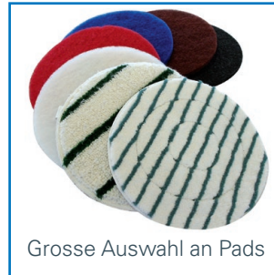
Grosse Auswahl an Pads