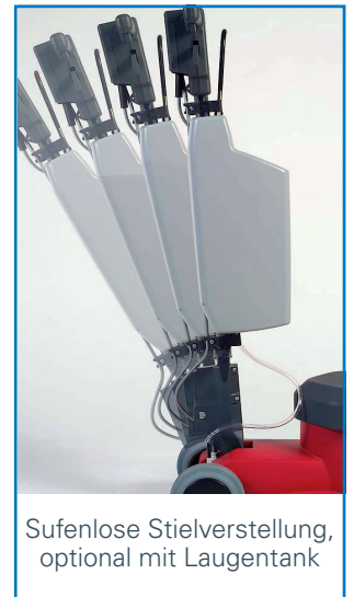
Stufenlose Stielverstellung, optional mit Laugentank