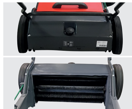
Verstellschraube für Hauptkehrwalze