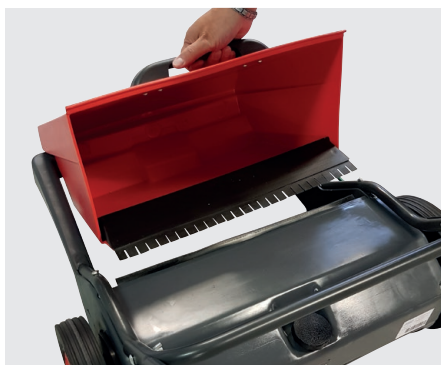
Einfache Entleerung des Schmutzbehälters