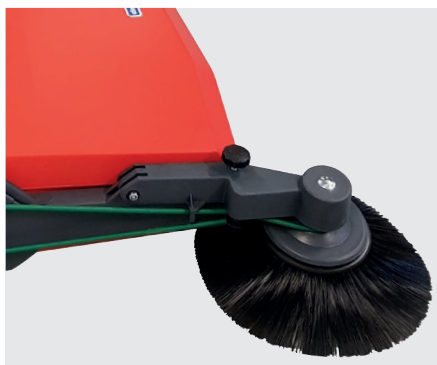
Verstellschraube für Seitenbesen