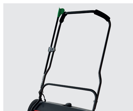
Sonderzubehör Stielhalter und Greifzange