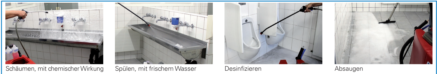
Schäumen, mit chemischer Wirkung