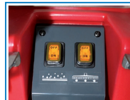
Einfache und verständliche Bedienung