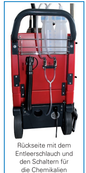
Rückseite mit dem Entleerschlauch und den Schaltern für die Chemikalien