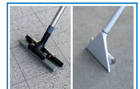
Adapter für Hartböden und Teppiche (Sonderzubehör)